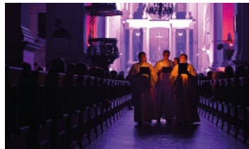
Marcel Pérès (Francia)

Clase magistral dirigida a cantantes y músicos interesados en la interpretación de música vocal del medioevo.