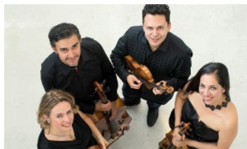
Cuarteto Q-Arte ( Colombia )

Los integrantes del Cuarteto Q-Arte hablarán sobre su trayectoria artística y su interés por la música contemporánea latinoamericana.