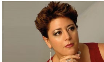
Gabriela Ortiz ( México )

Como preámbulo al concierto del Cuarteto Q-Arte, la compositora Gabriela Ortiz realizará una introducción sobre la obra Altar de Muertos y su trayectoria artística.